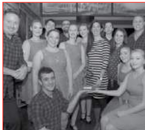
Ensemble folklorique Tam ti delam

Par la danse, la musique, les costumes et l'interprétation, les artistes de l'ensemble folklorique Tam ti delam ont réussi à montrer les réalités, les émotions des personnes atteintes de maladies mentales, et ce, grâce à leur performance remarquable.