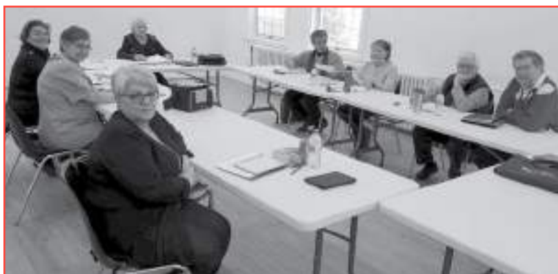
Formation : Le haïku, vers la publication d'un collectif