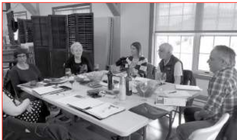
Rencontre territoriale de la MRC de Minganie du 15 mai 2018

La rencontre territoriale de la MRC de Minganie s'est déroulée à la Place des artisans de Havre-Saint-Pierre.