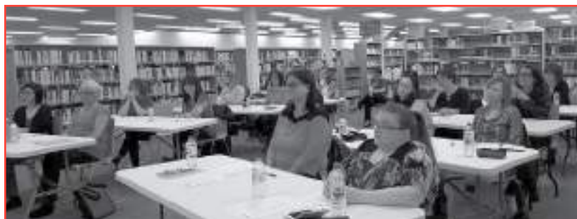
Formation : Tirer le meilleur parti des ressources numériques de votre Bibliothèque

Les demandes de perfectionnements individuels sont sans doute, le reflet d'un intérêt marqué pour l'acquisition de connaissances distinctives. Bien que les demandes en lettres aient légèrement baissé cette année, les arts visuels, arts de la scène et les lettres ont été davantage desservis. Témoins de l'élargissement du soutien, les artistes et les travailleurs culturels de notre région souhaitent perfectionner leur art et être plus confiants en leurs compétences.