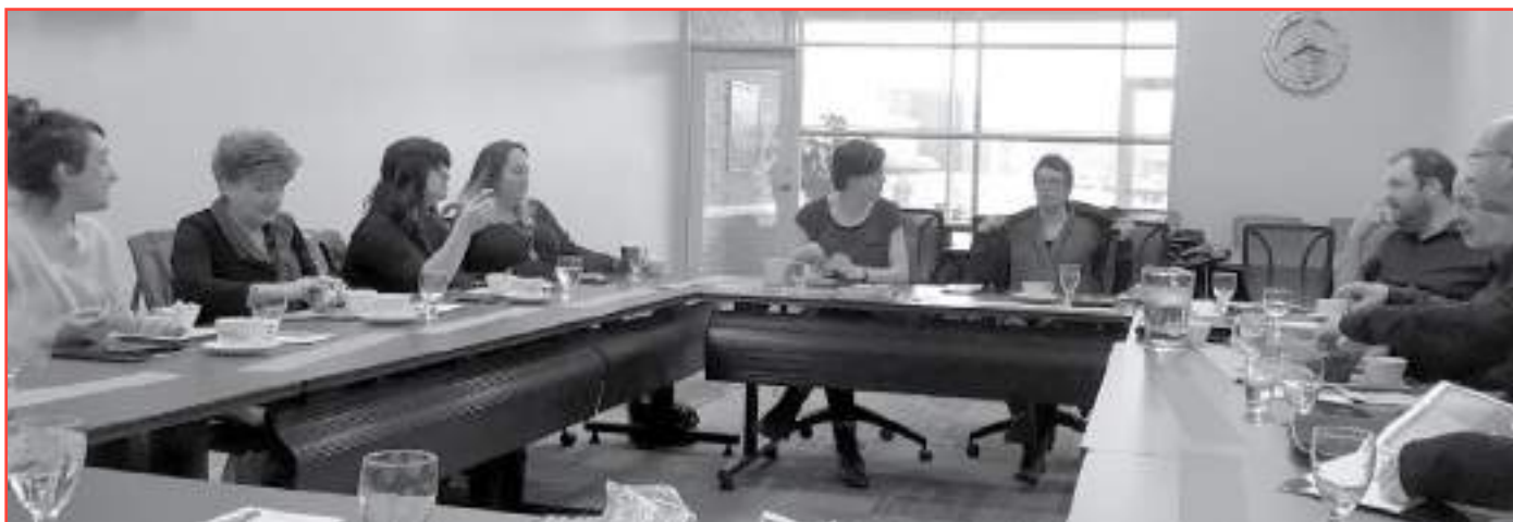
Rencontre territoriale de la MRC de Sept-Rivières du 14 mai 2018